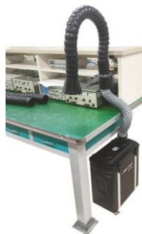
KCC 吸煙手臂轉接桌夾組裝後示意圖