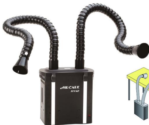
全機 DIY 組裝示意圖

通過 SGS 台灣檢驗科技股份有限公司檢測分析認證 報告號碼：PX/2018/90148