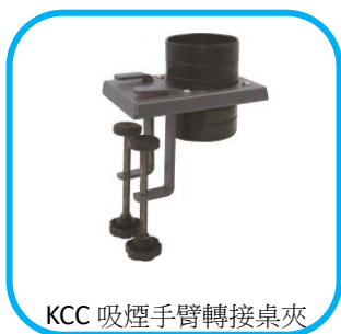
KCC 吸煙手臂轉接桌夾