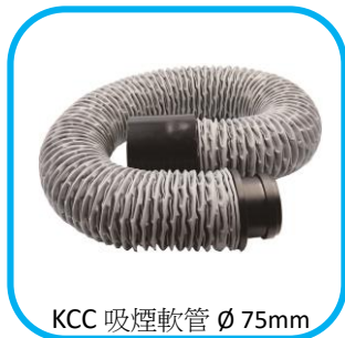
KCC 吸煙軟管 Ø 75mm